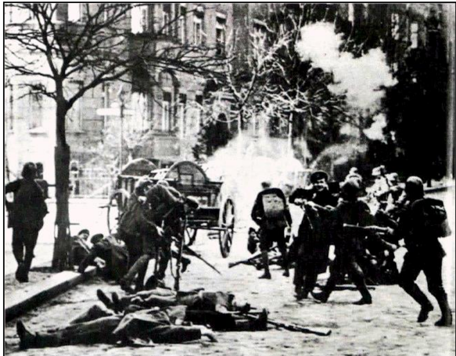
De communistische opstandelingen in Duitsland in de jaren 20 noemden zichzelf Spartakisten en adopteerden daarmee de leider van de slavenopstand als hun voorbeeld.

Marxisten gingen ook in de geschiedenis op zoek naar bewijzen die de theorie van Marx bevestigde. Zo wordt in de Great Soviet Encyclopedia in de beschrijving van